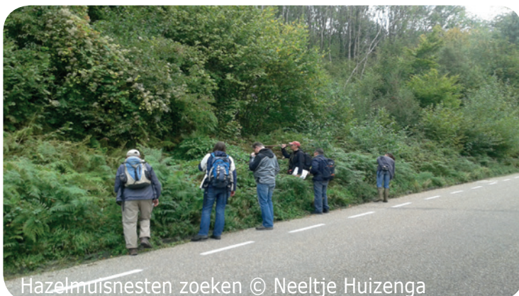
Hazelmuisnesten zoeken

Op zaterdag 10 september 2016 is van 14.00-16.00 uur de jaarlijkse startbijeenkomst voor het NEM Hazelmuismetnet. Deze wordt gecombineerd met de BioBlitz in GaiaZoo. Naast lezingen over hazel- en eikelmuis kunnen aanwezigen meedoen met het programma van de BioBlitz en een bezoek brengen aan GaiaZoo. Laat ons voor 1 september a.s. weten of je erbij bent. Deelnemers ontvangen het programma per mail. De eerste helft van september ontvangen tellers weer de formulieren voor komend telseizoen van 15 september t/m 30 november 2016.