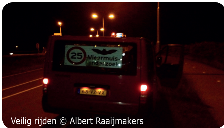
Veilig rijden