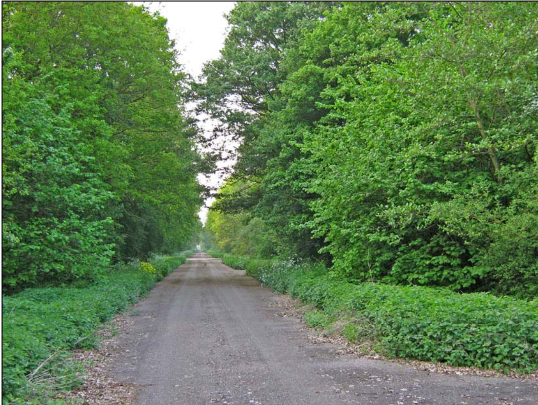
Afbeelding 2. Centrale laan in het MOB-complex.