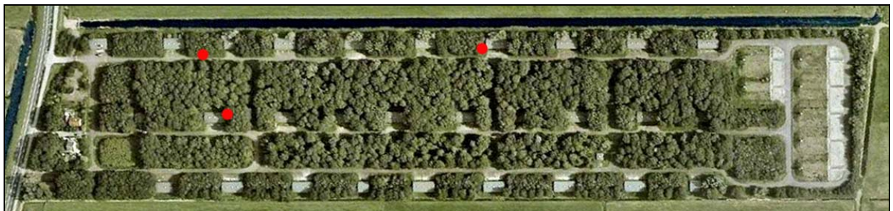
Afbeelding 10c. Waarnemingen (rode stippen) van gewone grootoorvleermuizen ( Plecotus auritus ) op het terrein van het MOB-complex Benschop.