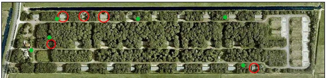
Afbeelding 10b. De ligging van de aangetroffen verblijfplaatsen van de gewone dwergvleermuis ( Pipistrellus pipistrellus ) op het terrein van het MOB-complex Benschop. Rode cirkels: verblijfplaatsen. Groene stippen: baitsend mannetjes.