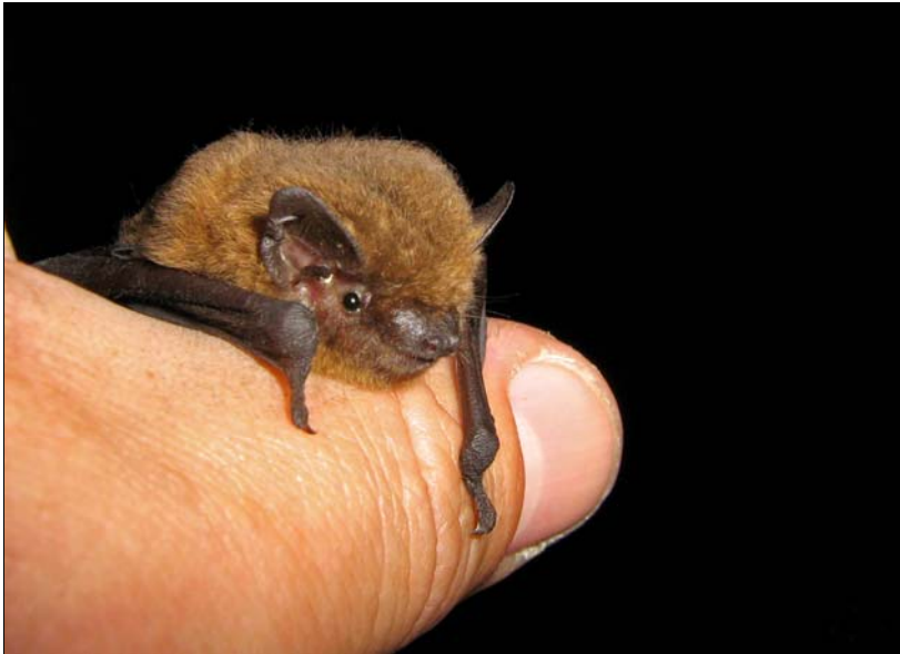
Afbeelding 9. Gewone dwergvleermuis ( Pipistrellus pipistrellus ) - Sterksel (Br) juni 2007.