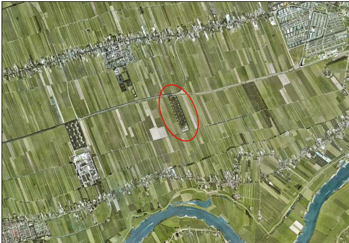
Afbeelding 1. De ligging van het MOB-complex Benschop (rood omlijnd) ten opzichte van de omgeving.