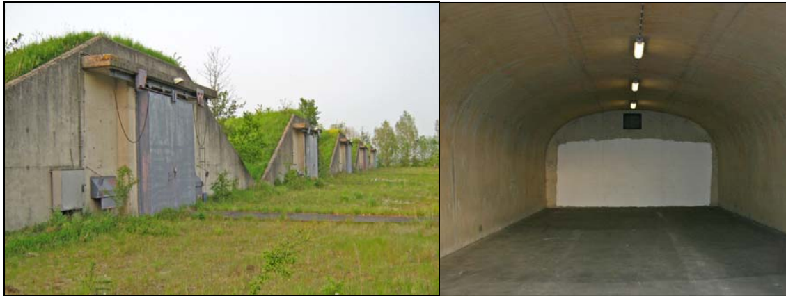
Afbeelding 7a/b. Foto links: NATO-bunkers op het MOB-complex Benschop. Foto rechts: binnenkant van één van deze bunkers.