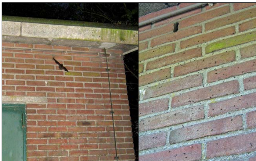
Afbeelding 6a/b. Foto links: invliegende dwergvleermuis ( Pipistrellus pipistrellus ) bij gebouw A2 in de ochtend van 2 mei 2009. Foto rechts: keutels van deze soort op de muur bij één van de spouwontluchtingsspleten in dit gebouw.

Een kaart met de aangetroffen verblijfplaatsen van de gewone dwergvleermuis is te vinden in bijlage 1.