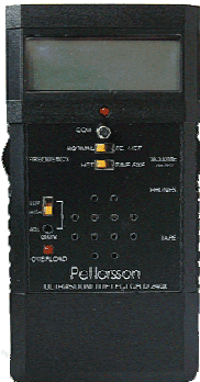
Afbeelding 4. Vleermuisdetector van het type Pettersson ultrasound detector D240x.

Bij het veldwerk werd gebruik gemaakt van vleermuisdetectors van het type Pettersson ultrasound detector D240x. Met dit type detector kunnen vleermuisgeluiden van moeilijk te determineren soorten als grootoorvleermuizen en soorten van het genus Myotis worden opgenomen en geanalyseerd. Tijdens het onderzoek gemaakte geluidsopnames zijn naderhand geanalyseerd met behulp van het programma BatSound van Pettersson Elektronik AB.