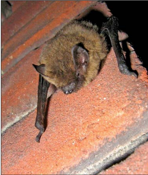
Afbeelding 5. Gewone dwergvleermuis ( Pipistrellus pipistrellus ) - Groningen, juni 2007.