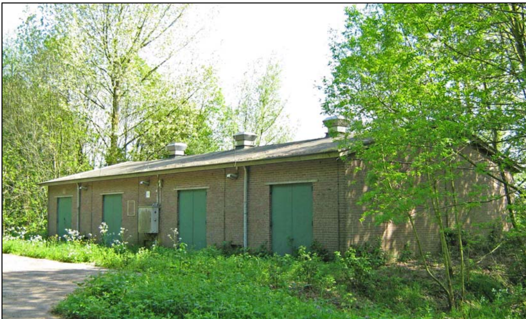
Afbeelding 3. Gebouw A2. In de spouw van dit gebouw is een verblijfplaats van de gewone dwergvleermuis ( Pipistrellus pipistrellus ) aangetroffen.