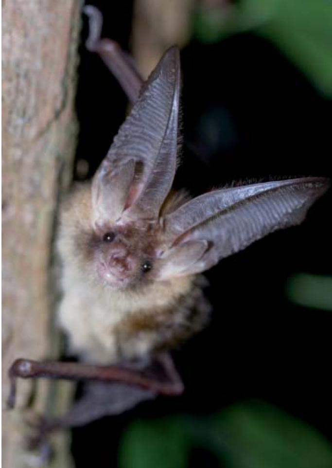
Gewone grootoorvleermuis.

Maar er zijn helaas ook objecten, bijvoorbeeld sommige forten van de Nieuwe Hollandse Waterlinie, waar die trend van overwinterters anno 2010/2011 negatief is. Verstoring door fout beheer, ongeleide restauraties en veranderingen in gebruik vertalen zich in slechte trends. Terwijl juist ook binnen de Waterlinie voorbeelden zijn van projecten van restauratie en herbestemming waar het heel goed gaat. Dat maakt duidelijk dat die in de vorige eeuw begonnen bescherming van objecten van groot belang is en geen moment mag verslappen. Tij-