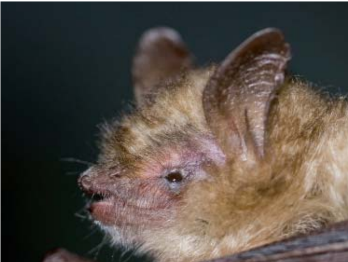
Ingekorven vleermuis.

nale dagblad De Gooi- en Eemlander. Het werd al snel duidelijk dat er grote belangstelling was voor het project. Er meldden zich 24 nieuwe personen. Ook namen nog vier medewerkers van Natuurmonumenten deel aan het onderzoek. In mei 2010 is er eerst een introductieavond gehouden waarbij het onderzoek werd toegelicht en informatie over de levenswijze van boommarters werd gegeven. Een paar dagen later is instructie gegeven over het gebruik van de fotovallen met toebehoren. Later is een tussentijdse evaluatieavond gehouden en aan het einde van