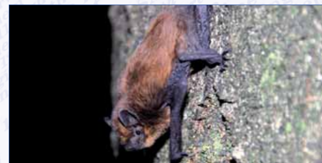
Gewone dwergvleermuis.