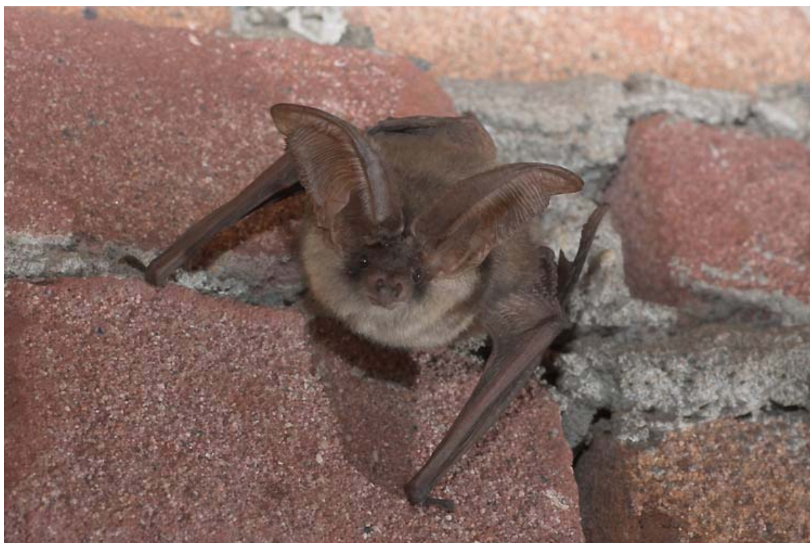
Grijze grootoor vleermuis.

Deze handleiding gaat tevens in op de determinatie van vleermuizen die op zolders aan te treffen zijn. Voordat men met het tellen van vleermuizen op zolders begint, is het noodzakelijk eerst een cursus te volgen en ervaring op te doen tezamen met andere, ervaren tellers.