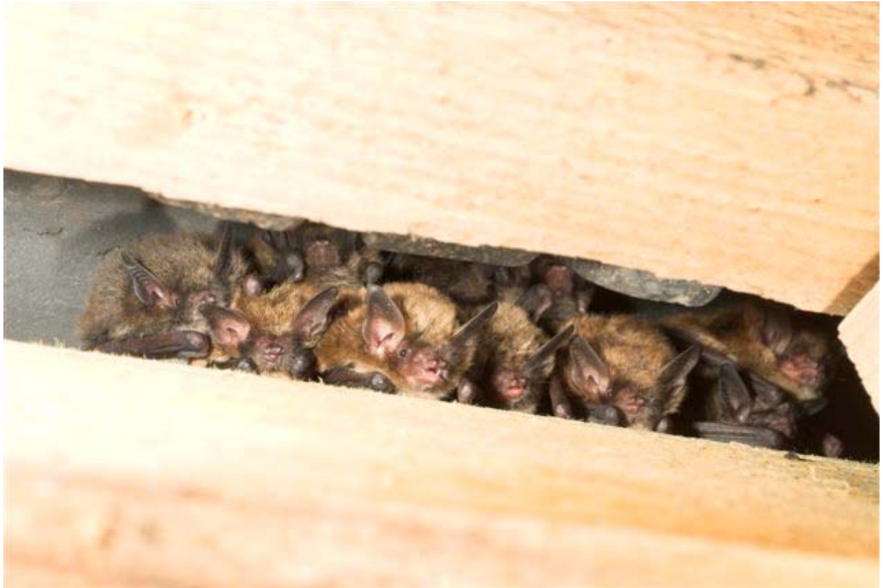
Kolonie Brandt's vleermuizen.

Het is soms behoorlijk moeilijk om grootte te schatten op grotere afstand. Desalniettemin maakt het nogal een verschil of je bij een dier de indruk hebt dat het een dier is met een laatvlieger- grootte of juist een dier met een grootte- indicatie van een dwergvleermuis. Als hulpmiddels kan het helpen dat de meeste planken die gebruikt worden op kerkzolders 8 centimeter breed zijn. Een laatvlieger “past daar net tussen”. Een gewone dwergvleermuis is half zo groot.