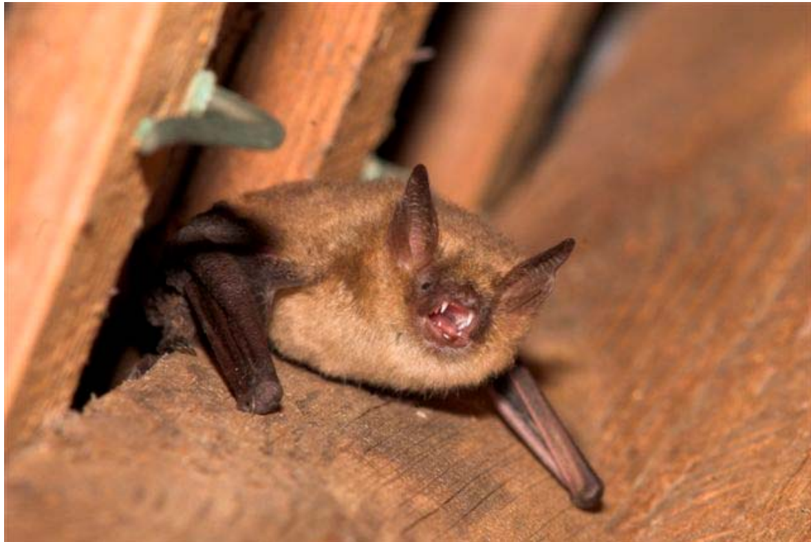
Ingekorven vleermuis.

Andere soorten die op zolders zijn aan te treffen (zoals laatvlieger, gewone grootoorvleermuis, baardvleermuizen), gebruiken ook andere verblijfplaatsen in de zomer, waardoor er voor deze soorten met alleen zoldertellingen geen goede trends te bepalen zijn. Wel leveren de zoldertellingen voor die soorten belangrijke verspreidinggegevens op.