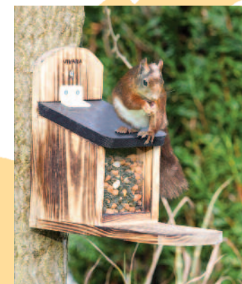
Eekhoorn voederhuis vivara.nl

Voeren In tuinen waar vogelvoer wordt aangeboden, weten eekhoorns dat vaak snel te vinden en ze eten daar graag van. Er zijn echter in de handel ook speciaal voor eekhoorns ontwikkelde voerautomaten en voermengsels te verkrijgen. Hang de voerautomaat wel hoog genoeg op, minimaal op 2 meter hoogte, zodat ze niet een gemakkelijke prooi zijn voor loslopende katten. Geschikt voedsel kunt u o.a. bestellen bij www.vivara.nl , waar ook geschikte voederkasten en nestkasten te koop zijn. Geef ze grove zaden, naturel noten (bij voorkeur walnoten, hazelnoten en pijnboomspitten), vers water en stukjes fruit en groente als komkommer en wortel te eten.