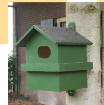
Eekhoorn woonhuis vivara.nl

Nestkasten Eekhoorns bouwen doorgaans hun eigen nesten van takken, mos en grassen in een kroon van een boom, maar ze maken ook gebruik van boomholten en daarom ook van nestkasten. Een eekhoorn gebruikt in korte tijd meerdere nesten. In de handel zijn speciale eekhoornkasten te verkrijgen. Hang ze zo hoog mogelijk op, maar minimaal op 4 meter hoogte en laat de ingang niet naar het zuidwesten of westen wijzen (tegen inregenen). Als de eekhoorns de kast accepteren en gebruiken, slepen ze deze vol met takjes, mos en grassen om een warm nest te bouwen. Een enkele keer komt het voor dat eekhoorns in een dergelijke kast ook hun jongen werpen. Dat is natuurlijk helemaal een feest!