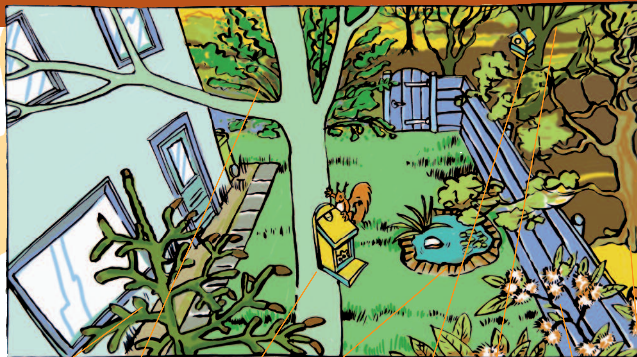
Fijnspar Hazelaar Voederhuis Vijver Nestkast Beuk Tamme kastanje Eik

Voedsel Het voedsel van eekhoorns bestaat hoofdzakelijk uit boomzaden zoals eikels, noten en zaden van naaldbomen. Ook eten ze als aanvulling daarop (afhankelijk van het jaargetijde) knoppen, bladeren, bessen, schors, paddenstoelen, rupsen, vogeleieren en jonge vogels.