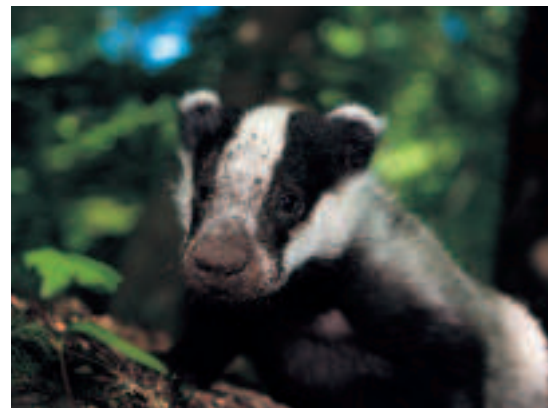
Ook jonge dasjes houden al van graven.