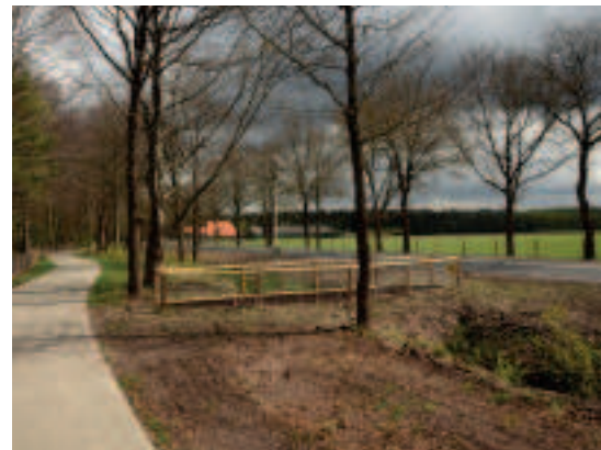
Faunapassages laten dassen veilig de overkant bereiken.