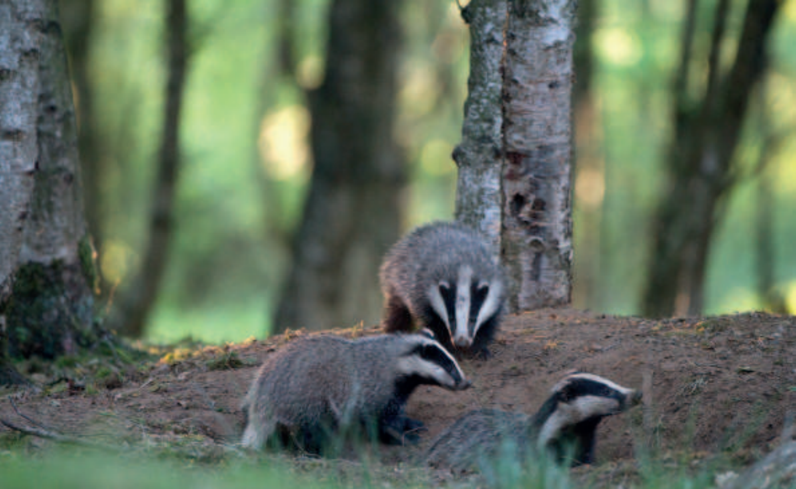
Dassenzeug met jongen op de burcht.