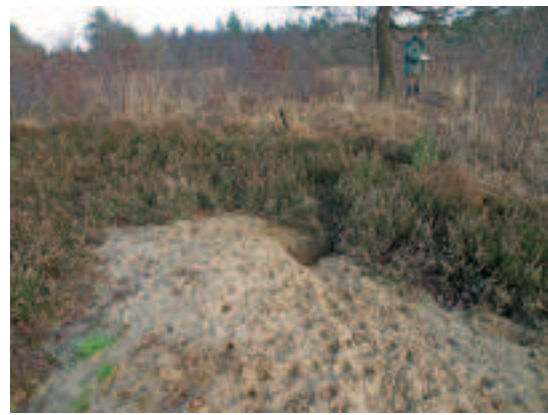
Inventarisatie van een dassenburcht. Getrainde waarnemers noteren informatie over dassenactiviteit.

In het 'Jaar van de Das' zijn veruit de meeste burcht-waarnemingen doorgegeven door de leden en waarnemers van de provinciale en regionale werkgroepen, waarvoor veel dank!