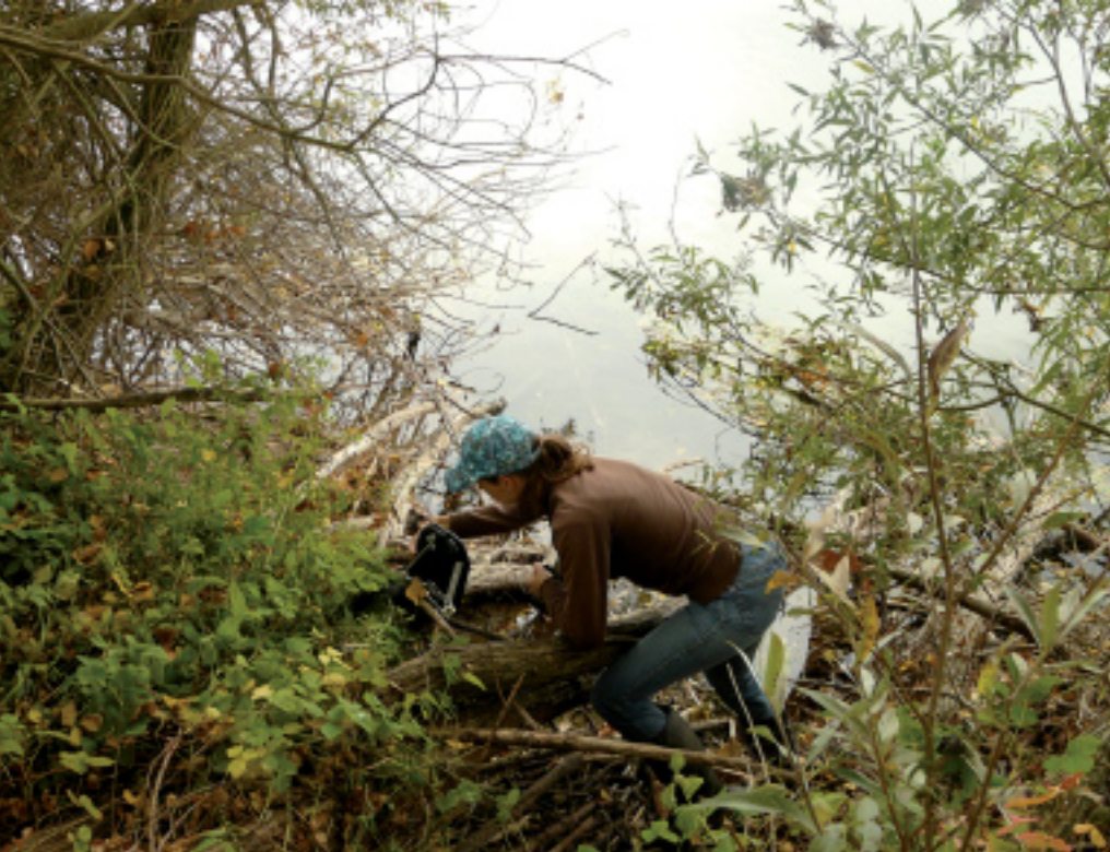
Het plaatsen van een cameraval.

te kunnen blijven volgen. Hierbij kan het zoeken door vrijwilligers naar takjes met tandafdrukken van 3,0 mm of kleiner als ondersteuning dienen om juveniele bevers op te sporen. Hierbij dient echter eventuele verwarring met sporen van de beverrat in gedachten gehouden te worden. In de Kekerdomse- en Millingerwaard is de beverrat ten tijde van het onderzoek echter niet waargenomen.