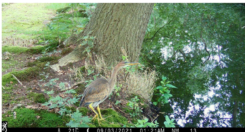
Purperreiger (Naardermeer)