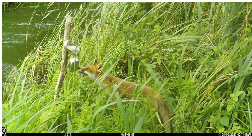
Vos (Naardermeer)