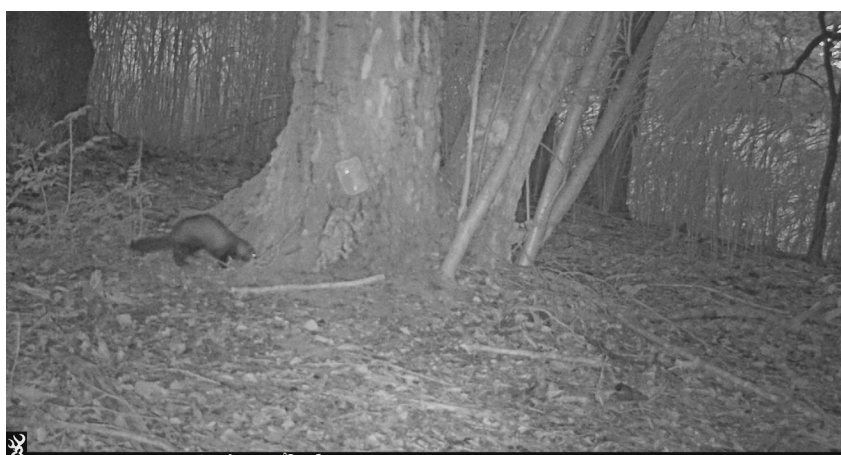
Bunzing (O van Oosterwijk)