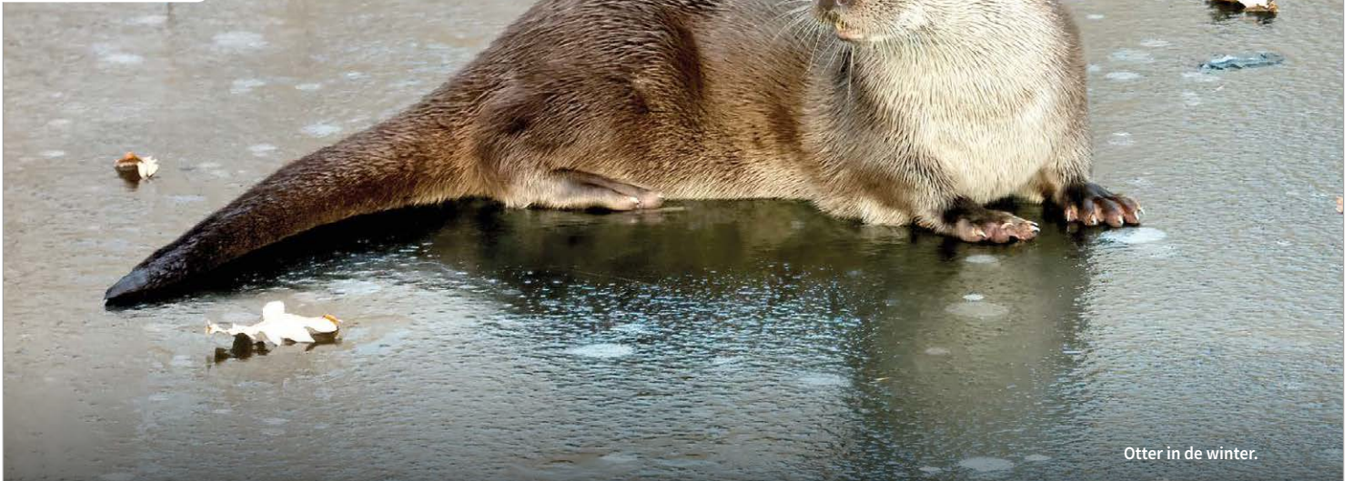
Otter in de winter.