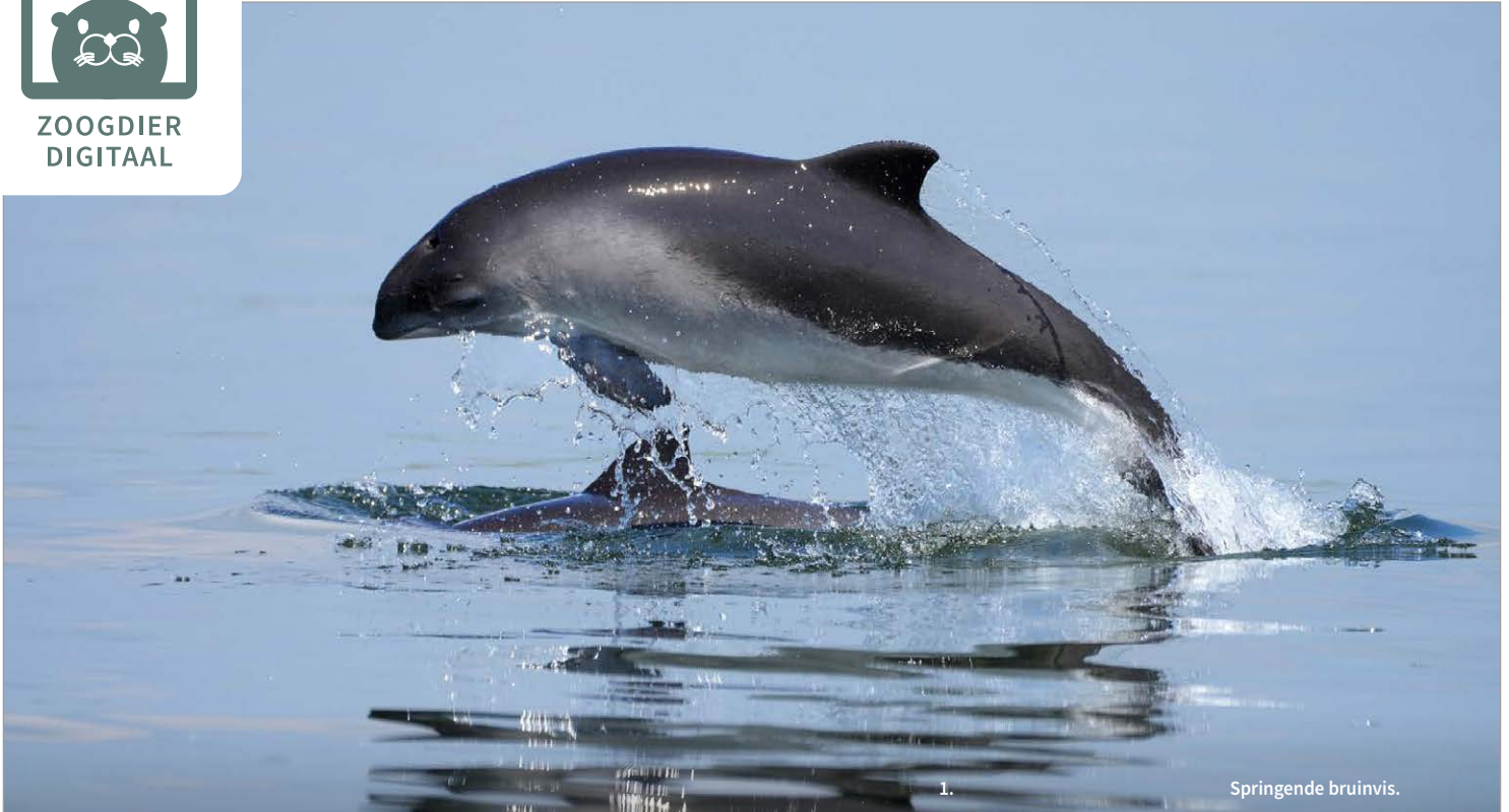
1. Springende bruinvis.

RESULTATEN VAN FOTO-IDENTIFICATIEONDERZOEK EN IMPLICATIES VOOR BEHEER EN BELEID