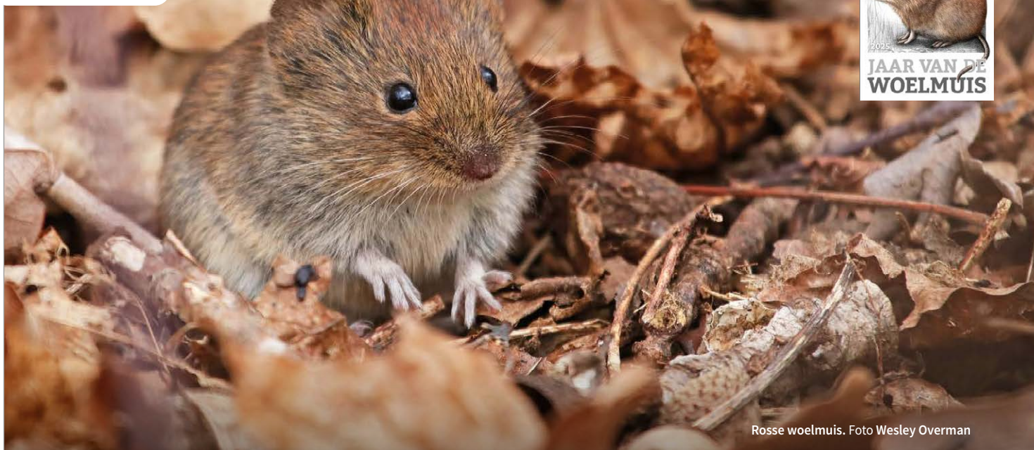
Rosse woelmuis.