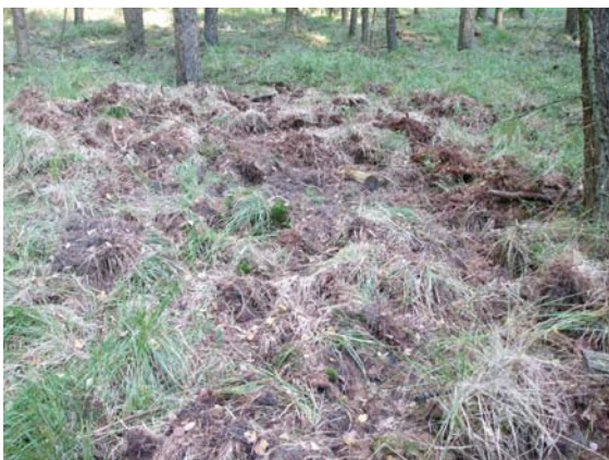
Hans van der Pols

Wilde zwijnen kunnen op zoek naar voedsel veel grond omwoelen. Dat wroeten is nuttig in het bos. De zaden van bomen worden onder de grond geploegd, zodat nieuwe planten kunnen groeien. In omgewoelde aarde kiemen de zaden gemakkelijker; ook