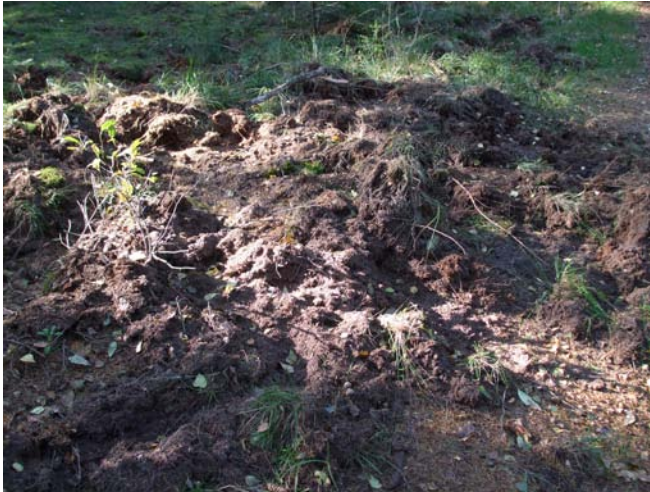
Hans van der Pols

De keutels van wilde zwijnen zien er uit als korte, aan de zijkanten wat afgeplatte worstjes die tot 7 cm lang kunnen zijn. De kleur hangt af van het gegeten voedsel. Het is meestal zwart maar kan ook geelgroen, donkergroen en bruin zijn. De keutels kunnen los liggen, maar ook aan elkaar klonten. Vaak zijn er duidelijke planten- of dierenresten in te herkennen.