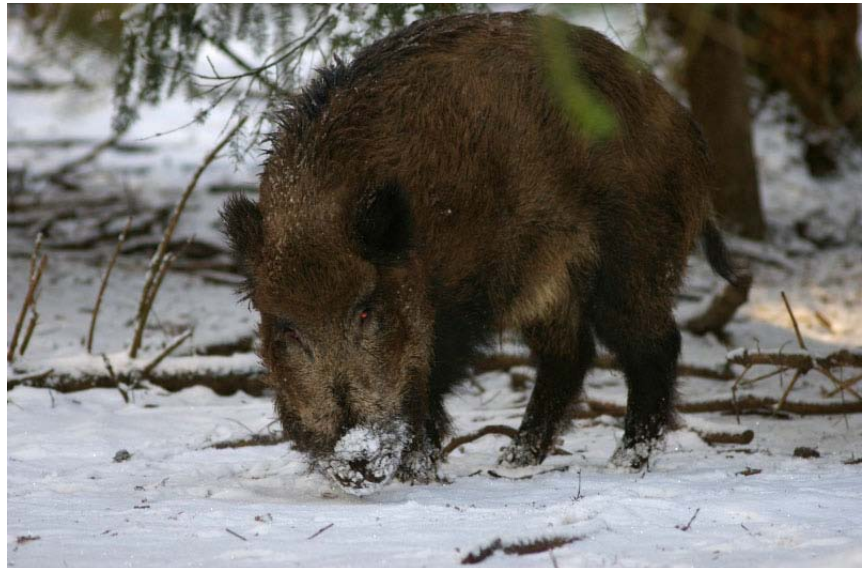
Robert van Sintmaartensdijk

's Winters zijn de haren veel langer en donkerder dan in de zomer en heeft hij een dikke ondervacht. In de lente vallen de winterharen uit en krijgt hij een kortere en lichtere vacht. Jonge wilde zwijnen hebben een week na de geboorte een zwartbruin-goudgeel gestreepte vacht. Deze lopen van voor naar achter over de rug. Na zes maanden wordt de vacht donkerder.