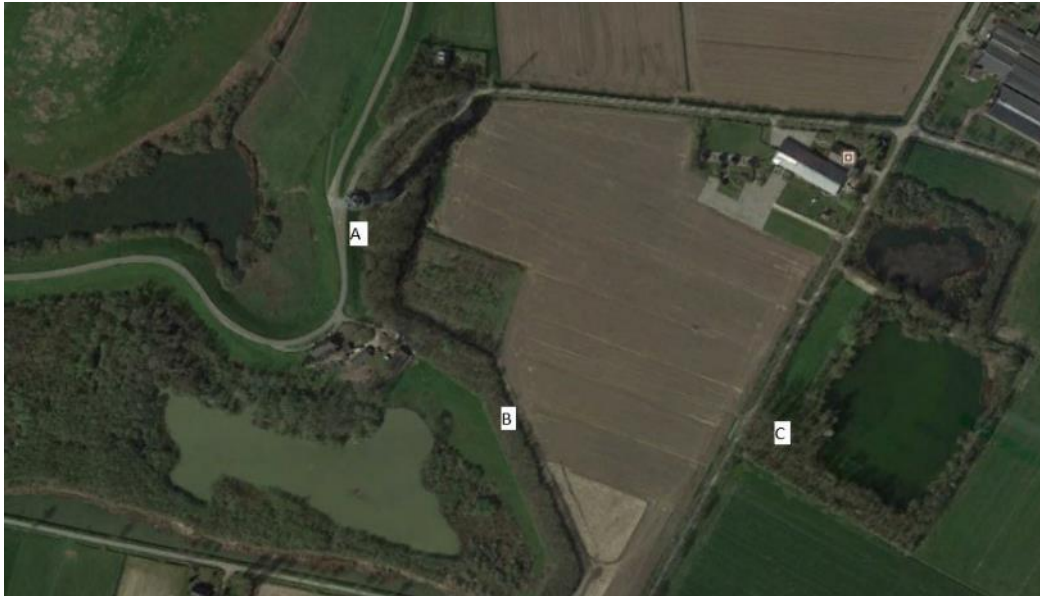
Figuur 4.2. Ligging van de dassenburchten bij Haren TV-toren (voor de verklaring van de letters, zie tekst).

Status d.d.: 17-06-2021, nog geen actie ondernomen.