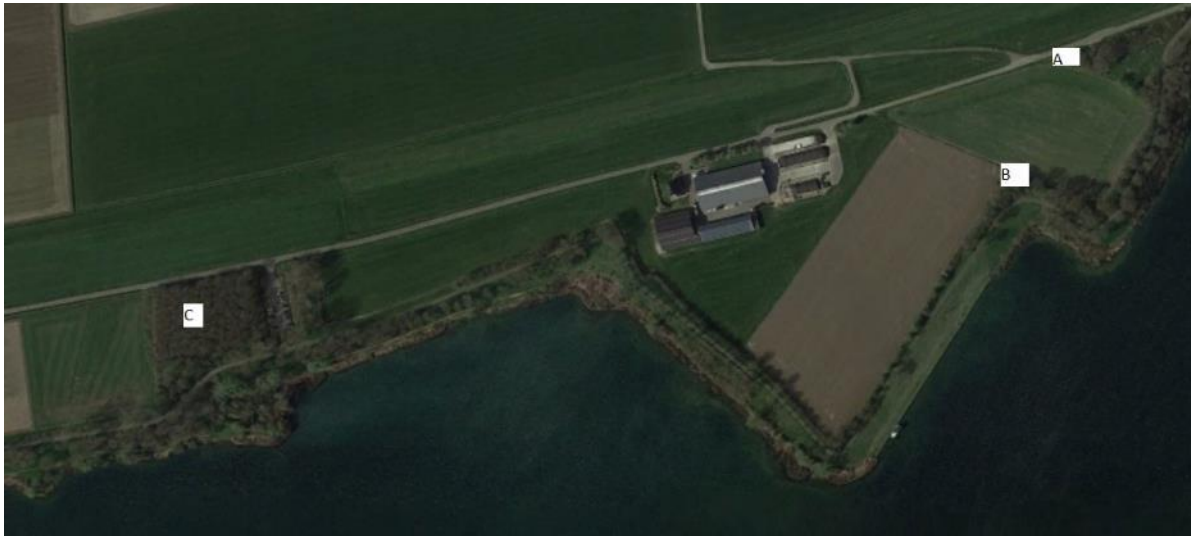
Figuur 4.9. Ligging van de dassenburcht bij Lommerstraat west (voor de verklaring van de letters, zie tekst).

Status d.d.: 17-06-2021, nog geen verdere actie ondernomen.