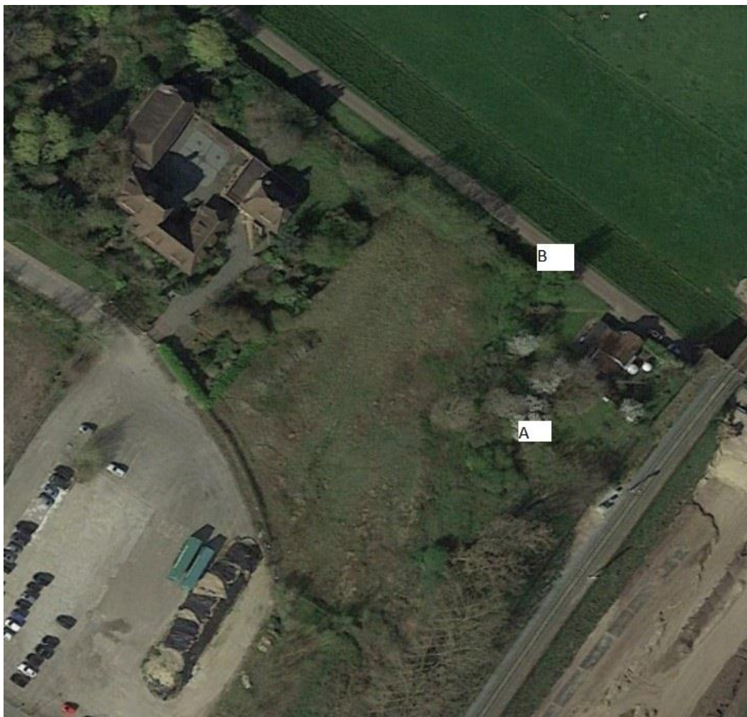
Figuur 4.11. Ligging van de dassenburcht bij de Everdineweerd (voor de verklaring van de letters, zie tekst).

Status d.d.: 17-06-2021, nog geen verdere actie ondernomen.