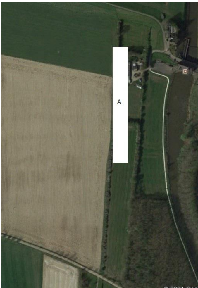
Figuur 4.6. Ligging van de dassenburcht bij van Sasse (voor de verklaring van de letters, zie tekst).