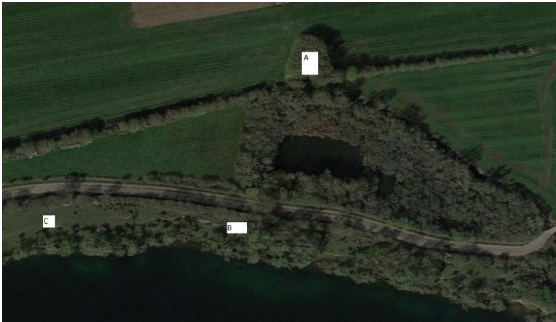
Figuur 4.8. Ligging van de dassenburcht bij Ganzenorgel (voor de verklaring van de letters, zie tekst).

Status d.d.: 25-06-2021 overleg opgestart met BL. Op korte termijn zal een veldbezoek met terreinbeheerder Gijs Looijen worden ingepland.