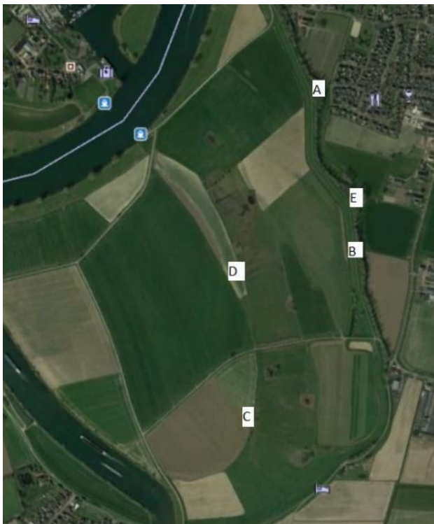
Figuur 4.1. Ligging van de dassenburchten bij Megen Kapel/Megen Dijk (voor de verklaring van de letters, zie tekst).

Amersfoort-coördinaten: 166.754-425.043 en 166.726-425.252