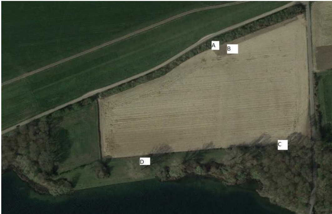
Figuur 4.10. Ligging van de dassenburcht bij Lommerstraat oost (voor de verklaring van de letters, zie tekst).