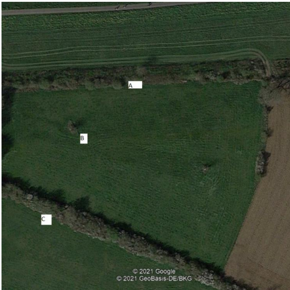
Figuur 4.7. Ligging van de dassenburcht bij de Cork (voor de verklaring van de letters, zie tekst).