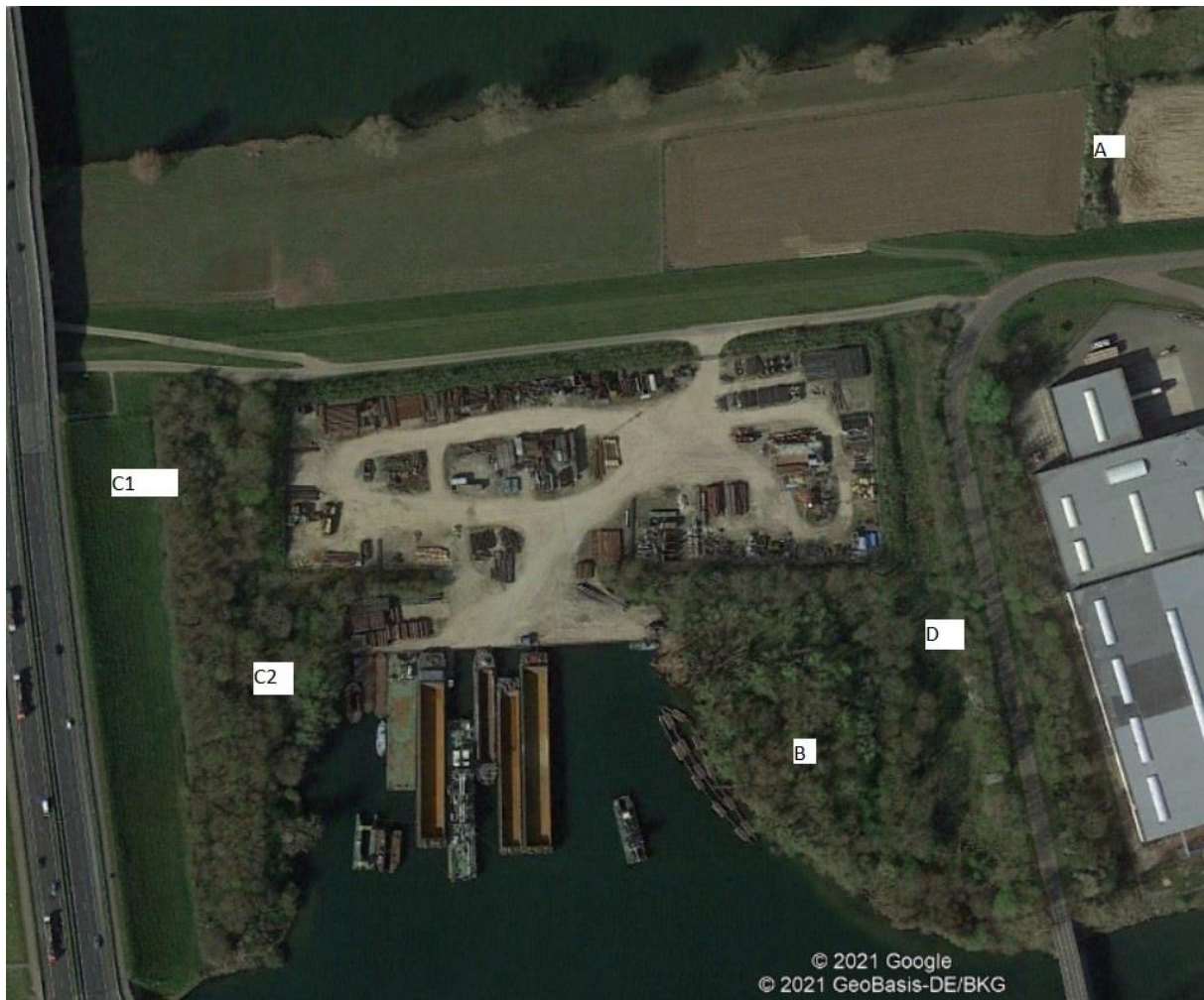
Figuur 4.11. Ligging van de dassenburcht bij de keersluis Smals (voor de verklaring van de letters, zie tekst).