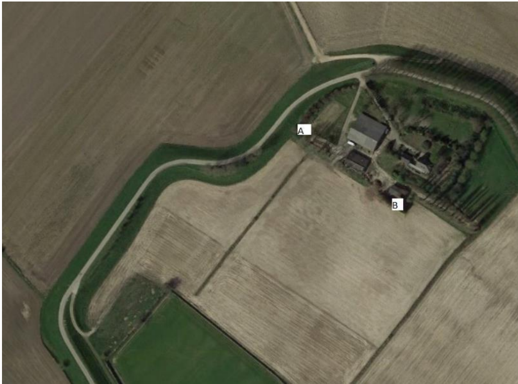
Figuur 4.3. Ligging van de dassenburchten bij Huis te Dieden (voor de verklaring van de letters, zie tekst).

Voor de aanleg van een alternatieve burchtlocatie is in de huidige situatie geen grond beschikbaar in de directe omgeving. WSAM is op zoek naar geschikte locaties. . Na de aanleg van een alternatieve burchtlocatie van voldoende grootte kan worden overgegaan tot het ontmantelen van de burcht onder de stalroosters.