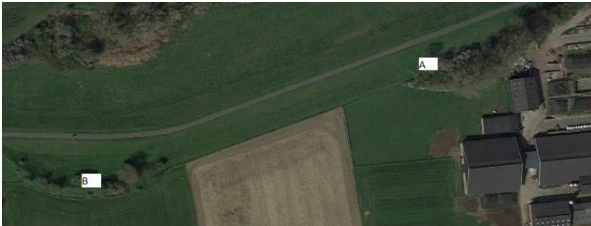
Figuur 4.5. Ligging van de dassenburcht bij Lage Wijth (voor de verklaring van de letters, zie tekst).

Omschrijving: oude, uitgebreide en druk belopen burcht (A, figuur 4.5) tussen de Maasdijk en een melkveebedrijf. De Burcht bevindt zich binnen beschermingszone A/B.