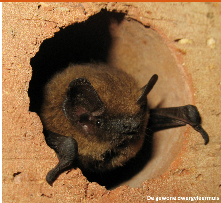
De gewone dwergvleermuis