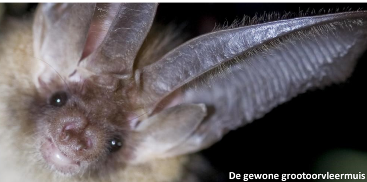
De gewone grootoorvleermuis