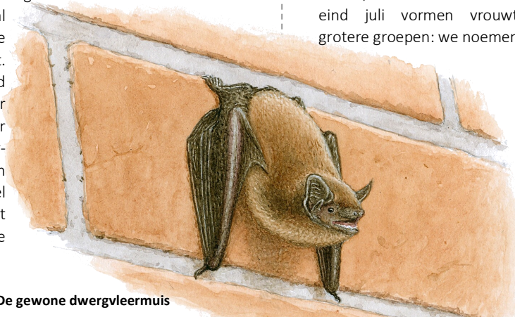
De gewone dwergvleermuis

Vanwege hun kwetsbaarheid, maar ook vanwege hun belangrijke functie in de natuur, zijn vleermuizen wettelijk beschermd. Dat betekent dat ze niet gevangen, gedood of hun verblijfplaatsen verstoord mogen worden.