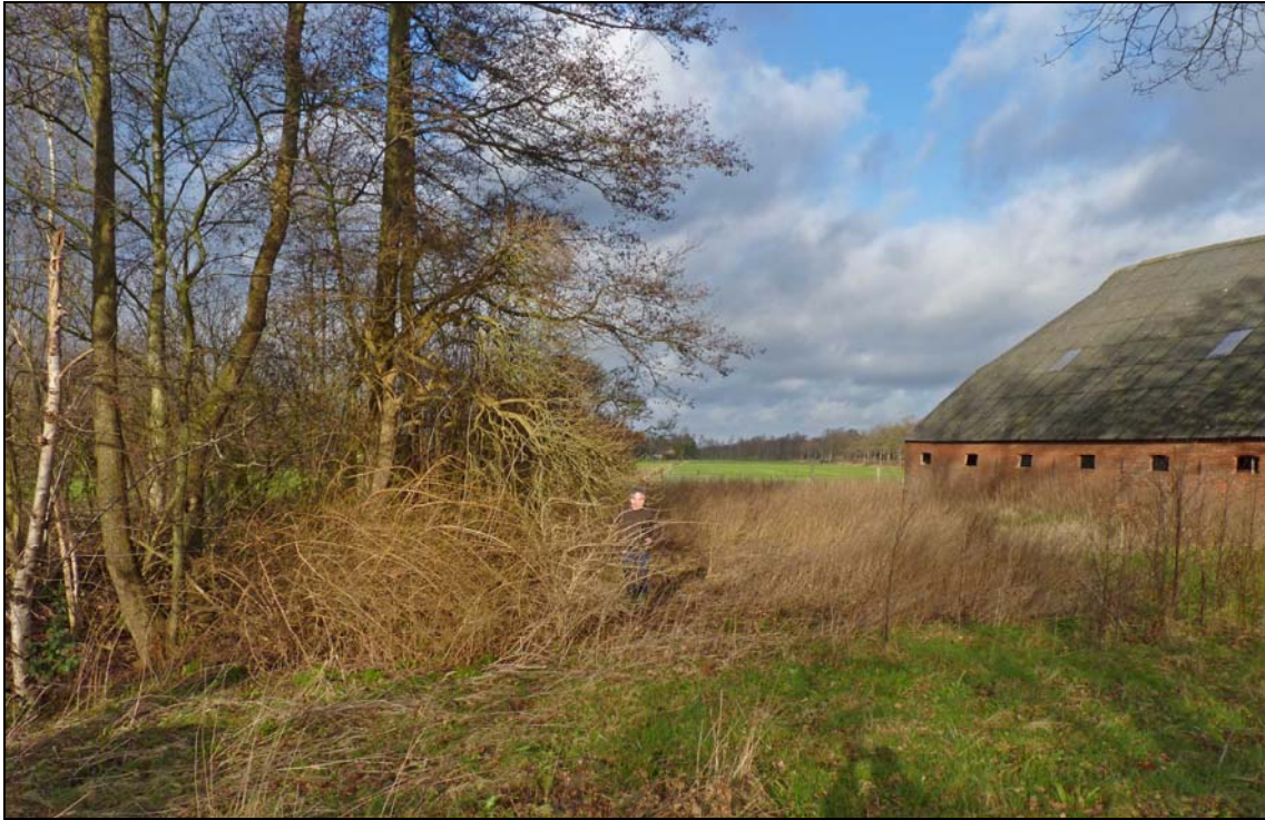
Afbeelding 2. Bomengroepje aan de zuidwestkant van het perceel Diepswal 46 te Leek waar de marterkasten geplaatst zullen worden. Rechts op de foto is het schuurgedeelte van de te slopen boerderij te zien.