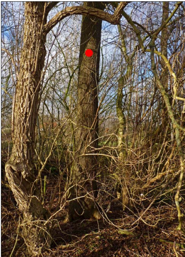
Afbeelding 3. De els in het bomengroepje waaraan een steenmarterkast zal worden opgehangen (de boom gemerkt met een rode stip). De kast dient op vier tot vijf meter hoogte te worden opgehangen.