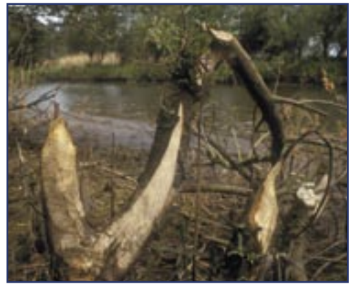
Bevers verraden hun aanwezigheid door hun geknaag.

In de Biesbosch liepen de wilgen in 2003 een paar weken eerder uit dan langs de Elbe. Daarna nam de kwaliteit, gemeten als fosforgehalte, van de bladeren in beide gebieden met dezelfde snelheid af (figuur 1a). Na correctie voor de verschillen in voorjaarstemperatuur - door de etmaaltemperaturen boven 5^{\circ}\text{C} vanaf 1 februari te sommeren, de zogenaamde temperatuursom - bleken de veranderingen in bladkwaliteit inderdaad over elkaar heen te vallen (figuur 1b). Boven een temperatuursom van 500 lopen de lijnen uiteen, vermoedelijk door lokale verschillen in standplaats, maar in beide gebieden wordt dat pas bereikt in juni. Dat betekent dat tot en met mei het fosforgehalte van de wilgenbladeren in een bepaald jaar te berekenen is uit het temperatuursverloop in dat jaar. Het spannende is dat we dus konden gaan kijken of er een verband bestaat tussen het zo berekende fosforgehalte en het (gebrek aan) voortplantingssucces in de Biesbosch.